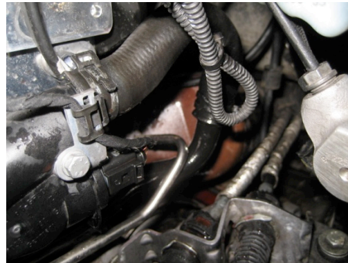
Doorverbinding kv slangen